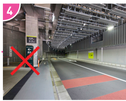
4 トンネルに入ってすぐ左手に見える入り口は搬入専用ですので、そのまま直進します。