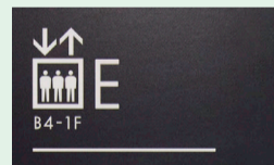
「Eエレベーター」をご利用の場合