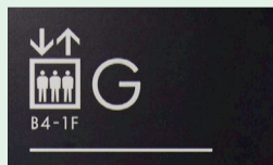
「Gエレベーター」をご利用の場合