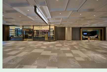
Eエレベーターから降りてホールを出ると、正面に「紅茶専門店ティーボンド」や「ブルニエ アール デュ キャビア フランセ」などがあります。ここより左手全体がマーケットエリアです。