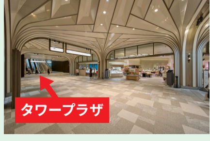
Hエレベーターから降りると目の前に「京都 八百一」があります。左手に進むと中央広場や森JPタワー、タワープラザに通じます。