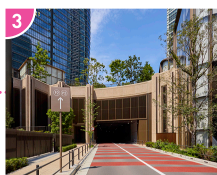
3 100mほど直進するとトンネルが見えてきます。