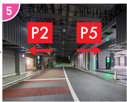
5 突き当たりまで進むと左右に入り口が分かります。左がP2、右がP5駐車場です。P5はマーケットにより行きやすい駐車場です。