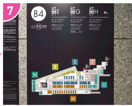
7 P5駐車場にはE、G、Hの3つのエレベーターがあります。どちらをご利用いただいてもマーケットの近くに出ることができます。