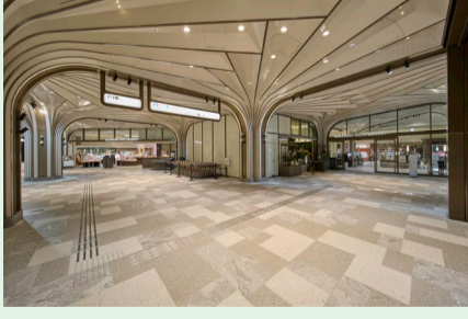
Gエレベーターから降りるとマーケットの中央、集合レジが一番近い場所に出られます。