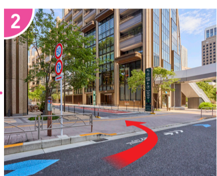
2 八幡通り(歩道橋手前)を左折、そのまま直進します。 ※左折してすぐのP6駐車場はマーケットからは遠くなります。