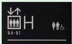
「Hエレベーター」をご利用の場合