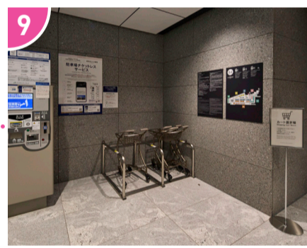
9 E、G、Hのエレベーターホールには、マーケット専用のカート置き場を設置しています。