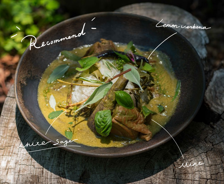
Green Curry with Herbs and Wild Plants ハーブと野草のグリーンカレー