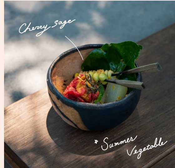
Pickled Summer Vegetables 夏野菜のピクルス